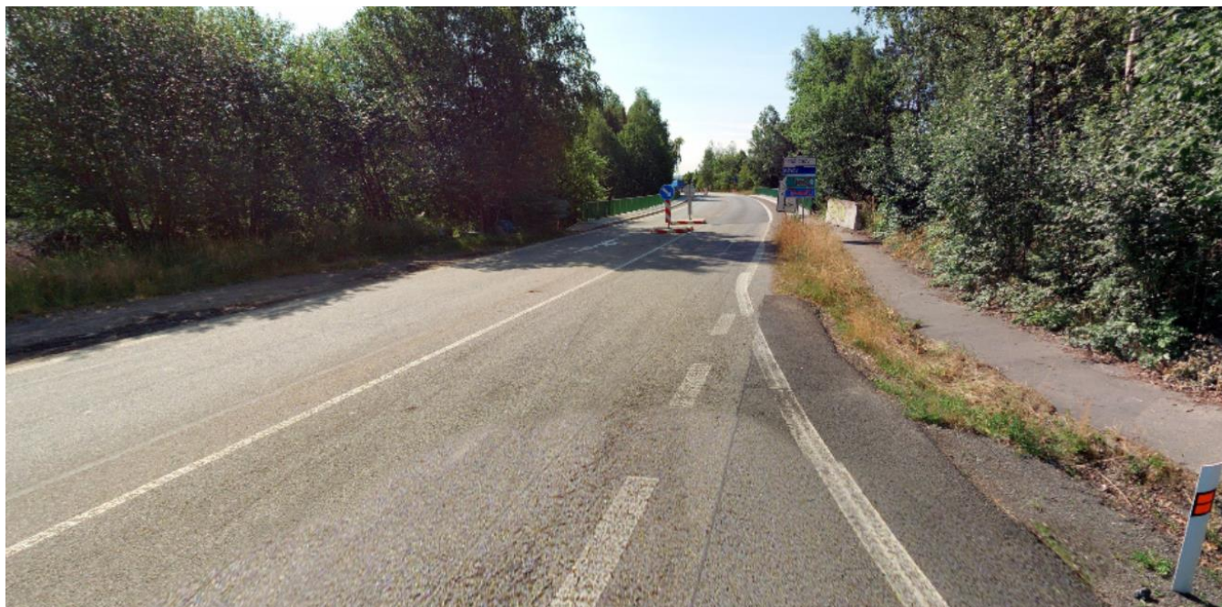
Pohled směrem do města, vlevo místo pro budoucí chodník