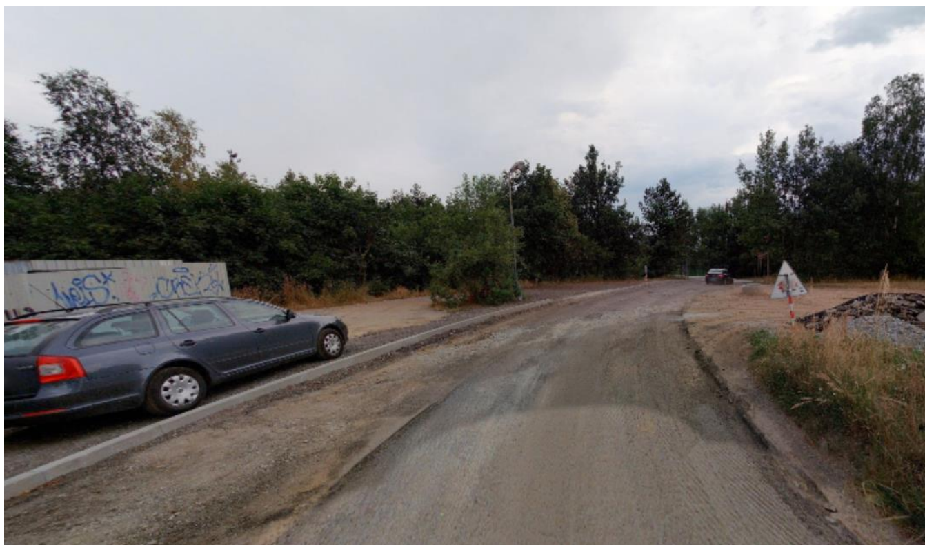
Druhý úsek chodníku na ul. Smrčenská, místo pro chodník vlevo za předem připravenými obrubami