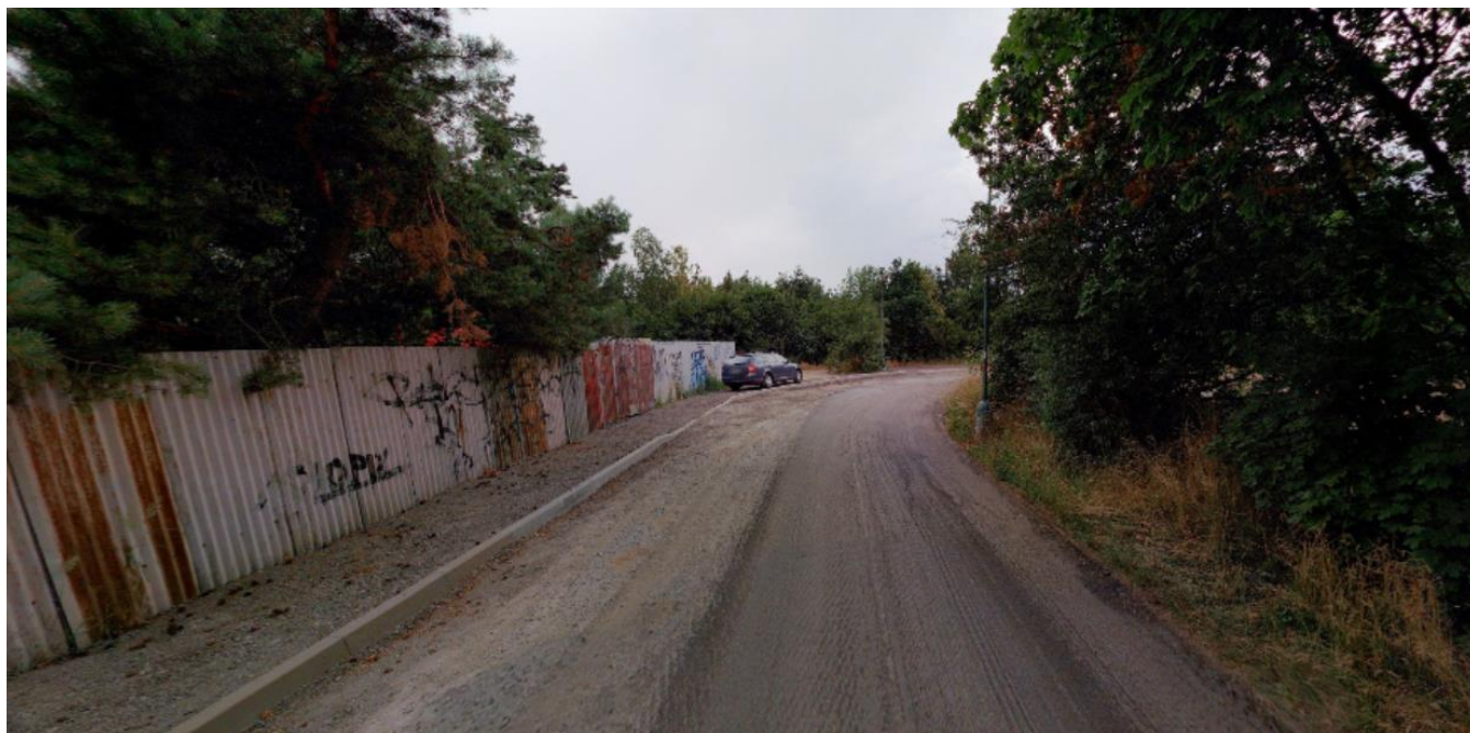
Druhý úsek chodníku na ul. Smrčenská, místo pro chodník vlevo za předem připravenými obrubami