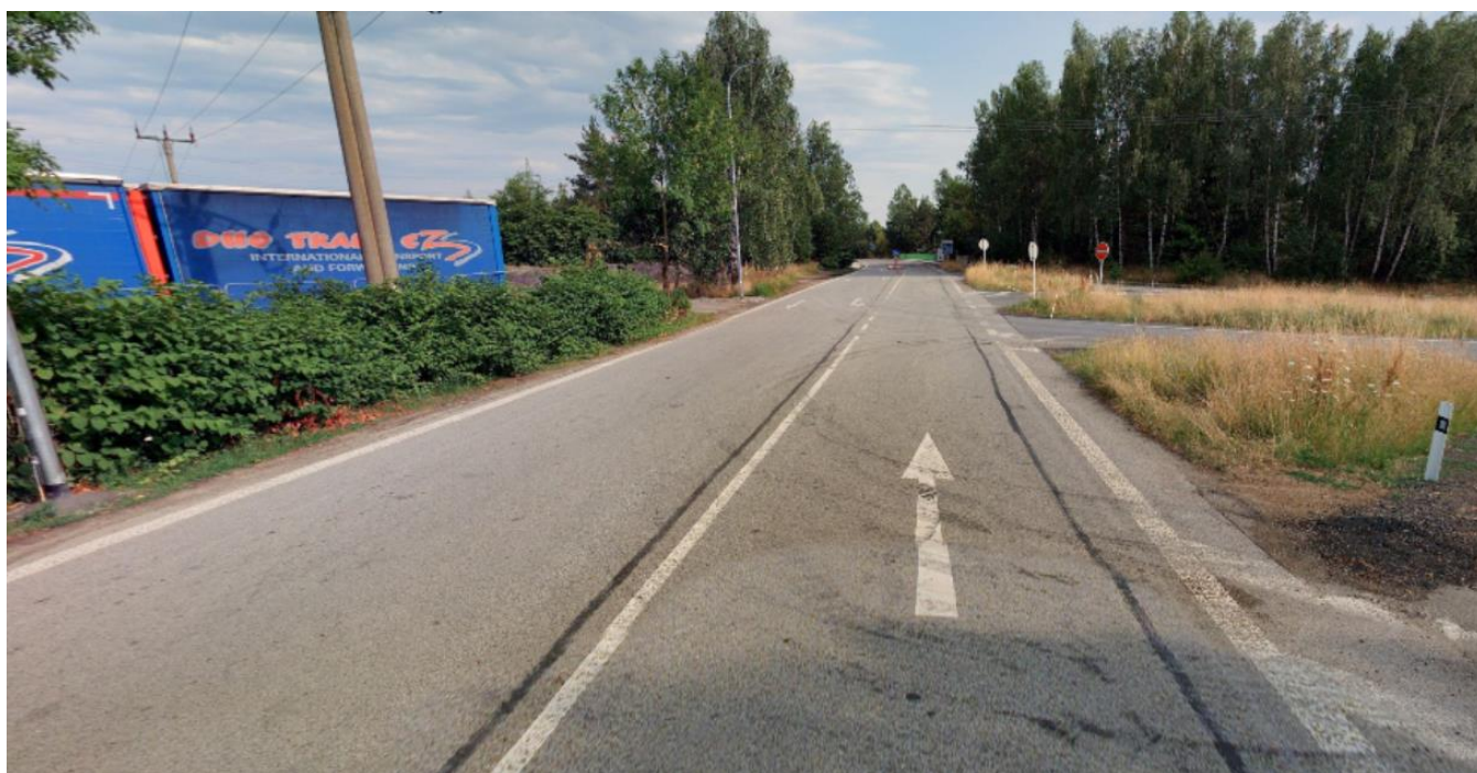
Pohled směrem do města, vlevo místo pro budoucí chodník