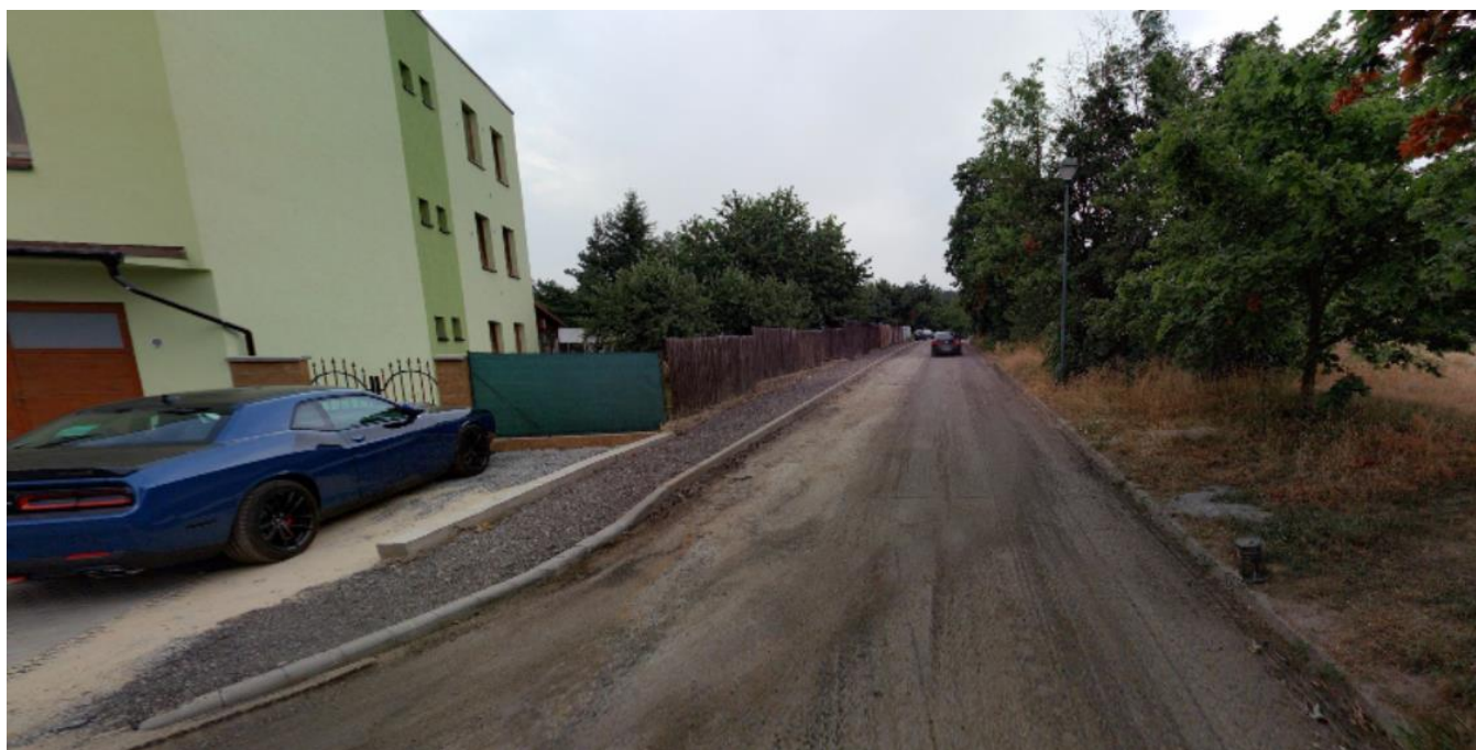
Druhý úsek chodníku na ul. Smrčenská, místo pro chodník vlevo za předem připravenými obrubami