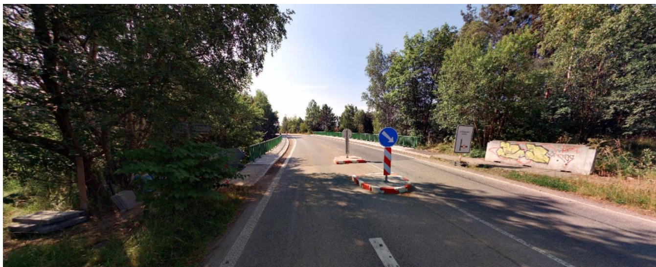
Pohled směrem do města, stávající provizorní dělicí ostrůvek u místa umožňující přecházení