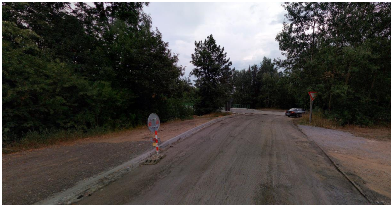
Druhý úsek chodníku na ul. Smrčenská, místo pro chodník vlevo za předem připravenými obrubami