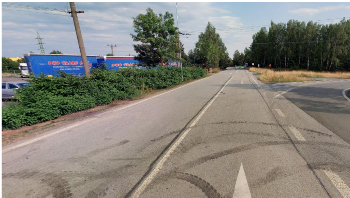
Pohled směrem do města, vlevo místo pro budoucí chodník