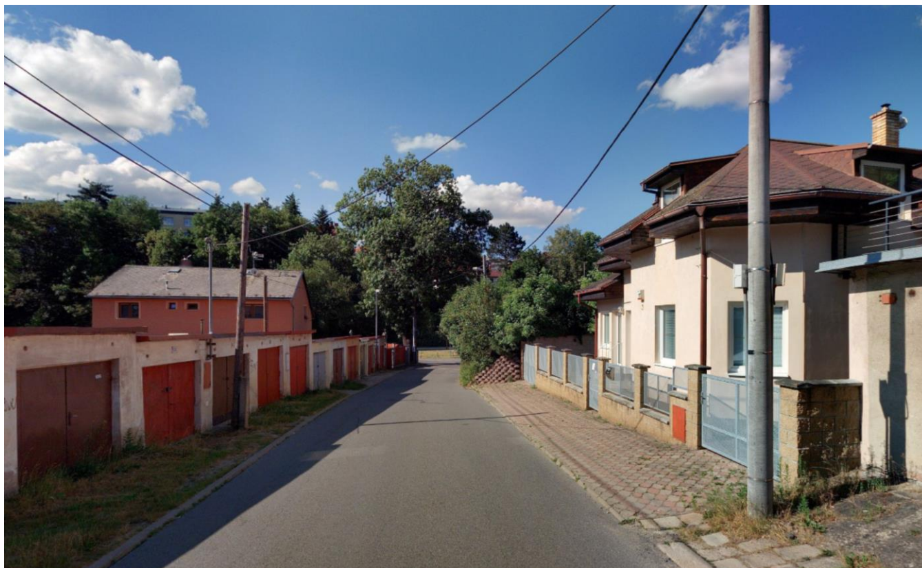
Pohled směrem do města, vpravo stávající chodník, na který naváže nový chodník