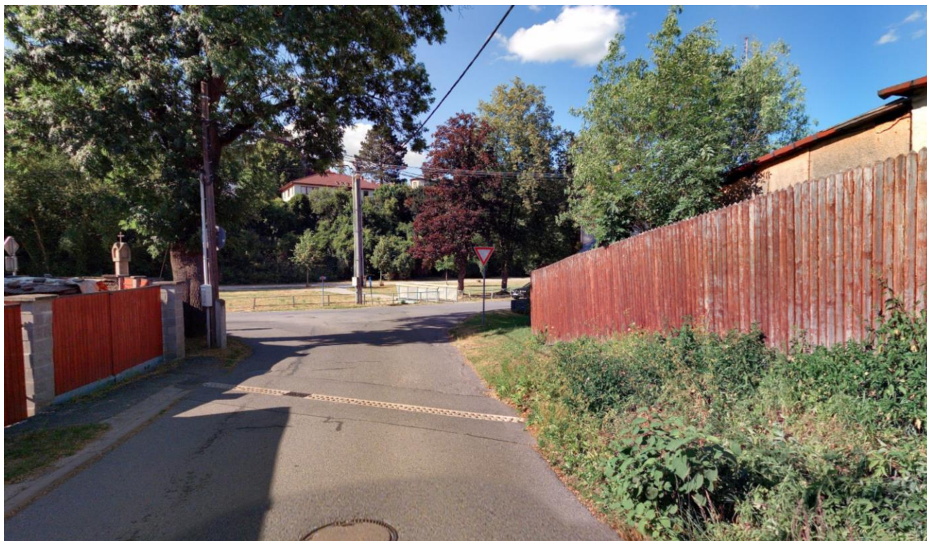
Pohled směrem do města, vpravo začátek budoucího chodníku v místě svahu