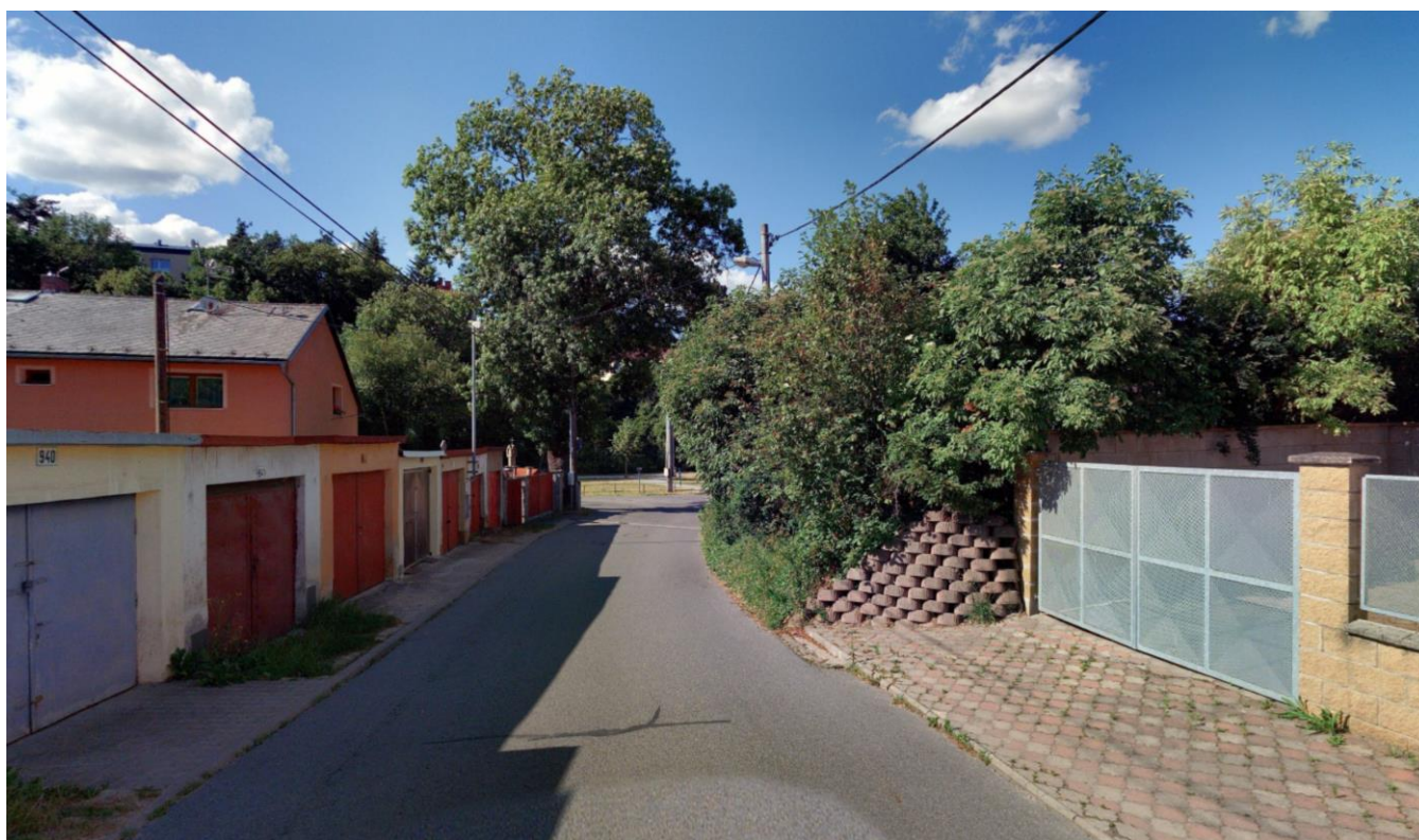
Pohled směrem do města, vpravo začátek budoucího chodníku v místě svahovek