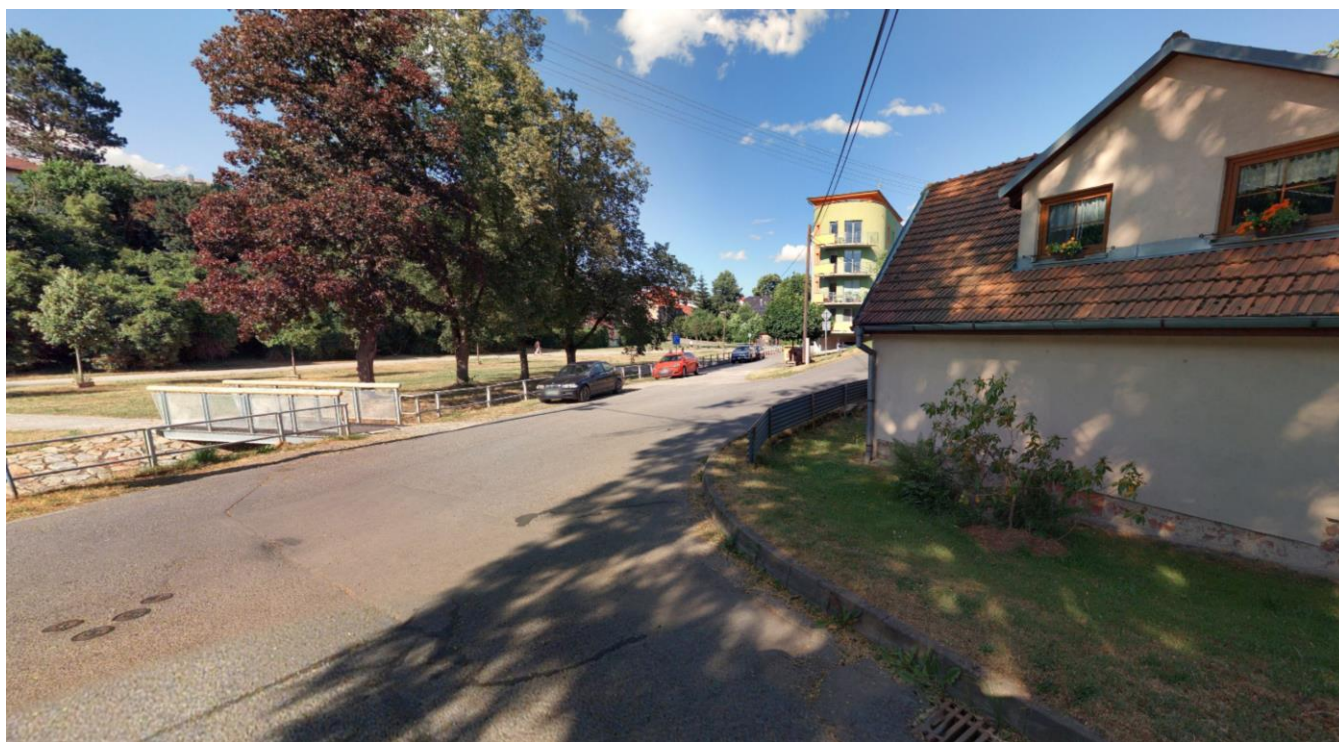
Pohled směrem ke stávající lávce, lávce bude chodník ukončen