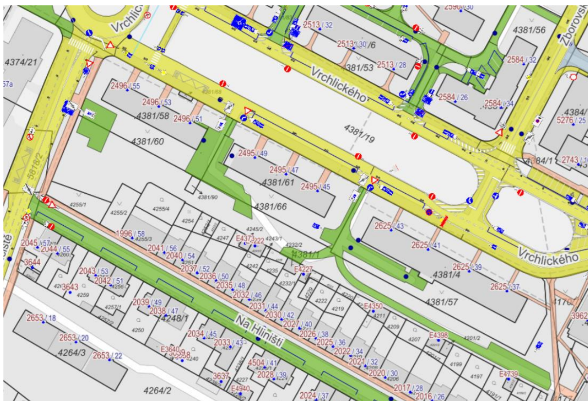
Obr. Výřez z pasportu místních komunikací – zájmové území