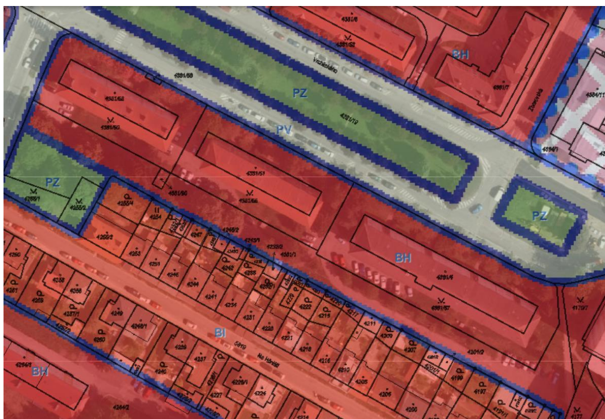
Obr. Výřez z územního plánu – zájmové území

Stavbou se nemění stávající využití pozemků. Stavba je tedy v souladu s územním plánem obce.